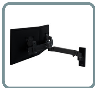
BARRA PER DISPLAY - DA SINGOLO A DUAL DIRECT N° 98-737