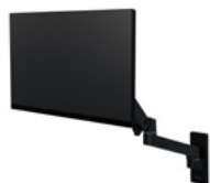
Braccio per monitor a parete LX Pro