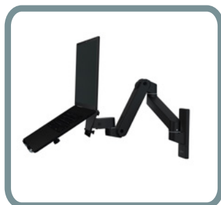
PORTA LAPTOP N° 50-193-200