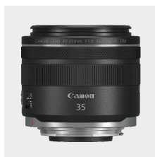
RF 35mm F1.8 MACRO IS STM