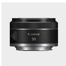
RF 50mm F1.8 STM