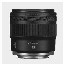
RF 45mm F1.2 STM