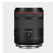
RF 50mm F1.4 L VCM