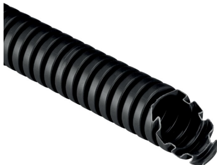
IMMAGINE RAPPRESENTATIVA EC REPRESENTATIVE IMAGE

Tubi e raccordi > Tubi > Tubi corrugati > Tc15 - pvc - 33212 - 750 n > Tubo in plastica per impianti elettrici > Nero