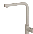
MKKTRP95 K95 8031873005023