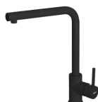
MKKTRP86 K86 8032557561491