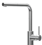
MIKTRPCR CR 8031873651671