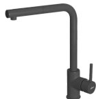
MGKTRP59 G59 8031873103590