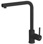
MGKTRP40 G40 8031873103651