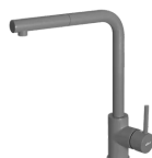
MKKTRP99 K99 8031873005030