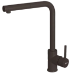
MGKTRP78 G78 8031873104436