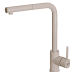
MGKTRP51 G51 8031873103606