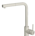
MGKTRP39 G39 8031873005016