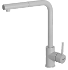
MMKTRP79 M79 8031873551391