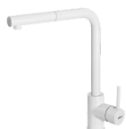
MKKTRP96 K96 8032557561484