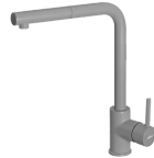
MGKTRP48 G48 8031873103569