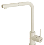
MGKTRP62 G62 8031873103583