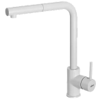
MGKTRP68 G68 8031873103644