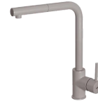
MGKTRP43 G43 8031873103576